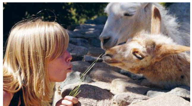
Obr.2: Úzky kontakt zvierata s človekom v kontaktnej ZOO

pozornosť aj zoonotickým patogénom (obr. 1 a 2). Tento text preto poskytuje prehľad často požadovaných vyšetrení a užitočných testov pre kamelidy Nového sveta v kontexte biologickej bezpečnosti.