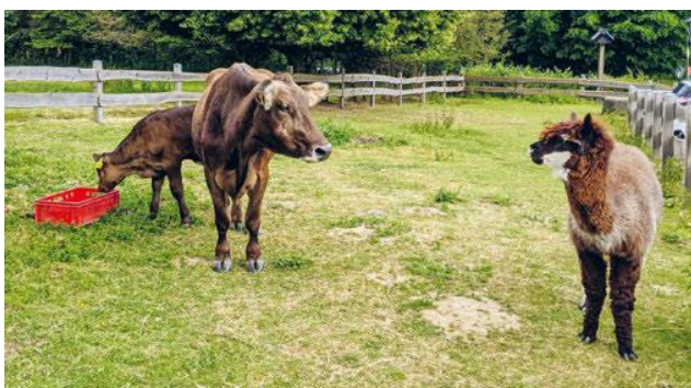
Obr. 5 + 6: Keď sú kamelidy držané spolu s koňmi alebo prežúvavcami, existuje možnosť prenosu infekčných agensov.

Žiaľ, výter od samca je prakticky nemožný z dôvodu veľmi zlej dostupnosti penisu.