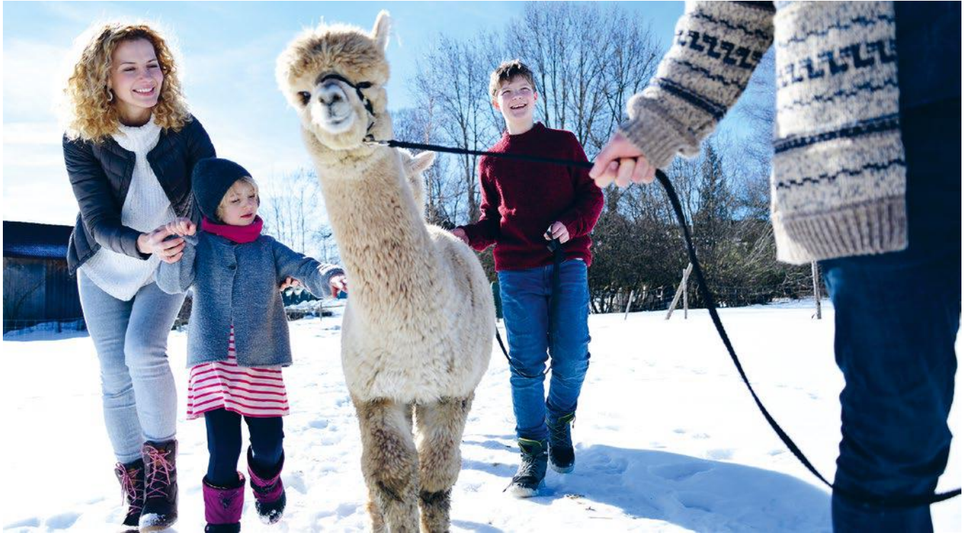
Obr. 1: Pri trekingu s alpakou alebo lamou dochádza k úzkemu kontaktu medzi zvieratom a človekom